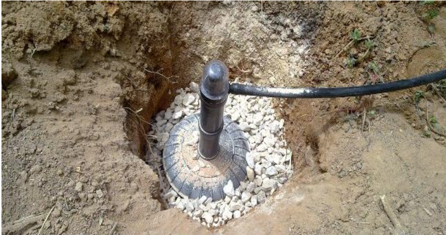
الشكل 2 قوارير الري بالتنقيط تحت السطحي