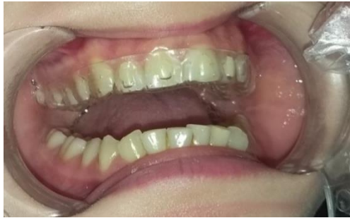
الشكل (1) للباحث التطبيق السريري للراصفات